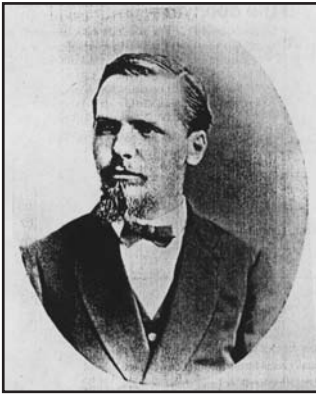
Retrato de Paul Langerhans (tomada del trabajo de Reichart, P.A. et al).

Durante 13 años se dedicó a la práctica médica y a la investigación relacionada con la biología, especialmente fauna marina y gusanos en la Isla de Madeira y en las Islas Canarias (6).