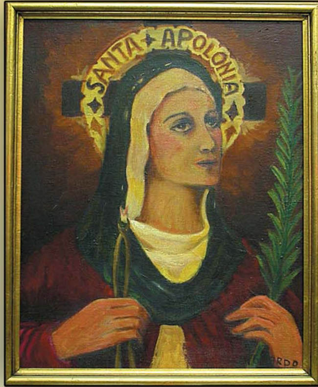
Apolonia Santa Patrona de la Odontología.