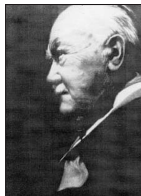
Dr. Arturo Jauretche.

A las muchas congratulaciones recibidas por este Archivo y Museo Histórico, agregamos las nuestras, cordiales.