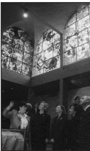
Público y vitrales de Chagall, en la Sinagoga.

En estos tiempos difíciles y crueles para la región y para el mundo, esta bella ofrenda de Chagall es un símbolo.