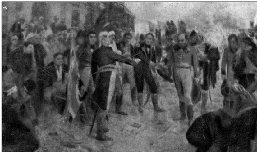
Rendición de Beresford. "...una tensa expectativa ha sucedido al griterío: Beresford, descubierta la cabeza y sin espada (la ha entregado a Mordeille), llega ante Liniers que lo espera bajo un arco del Cabildo". José María Rosa - Historia Argentina - Tomo 2.