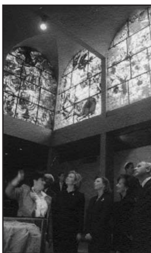
Público y vitrales de Chagall, en la Sinagoga.

En estos tiempos difíciles y crueles para la región y para el mundo, esta bella ofrenda de Chagall es un símbolo.